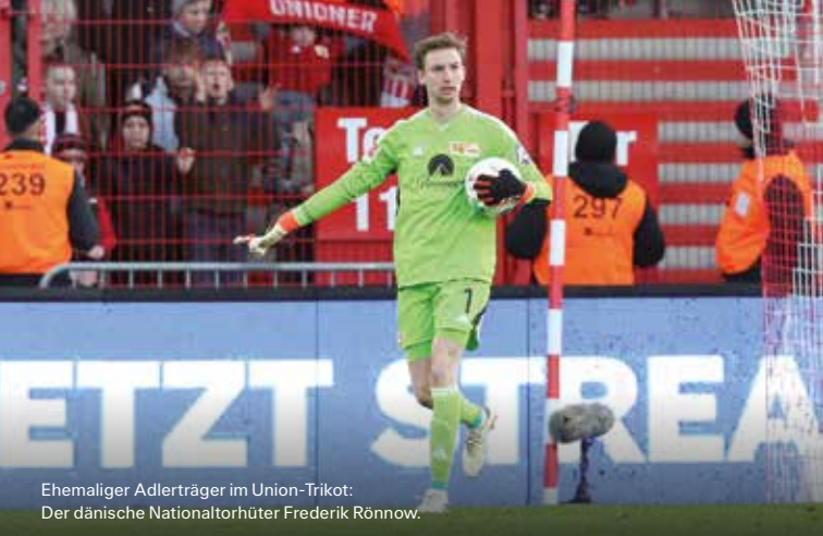
Ehemaliger Adlerträger im Union-Trikot: Der dänische Nationaltorhüter Frederik Rönnow.